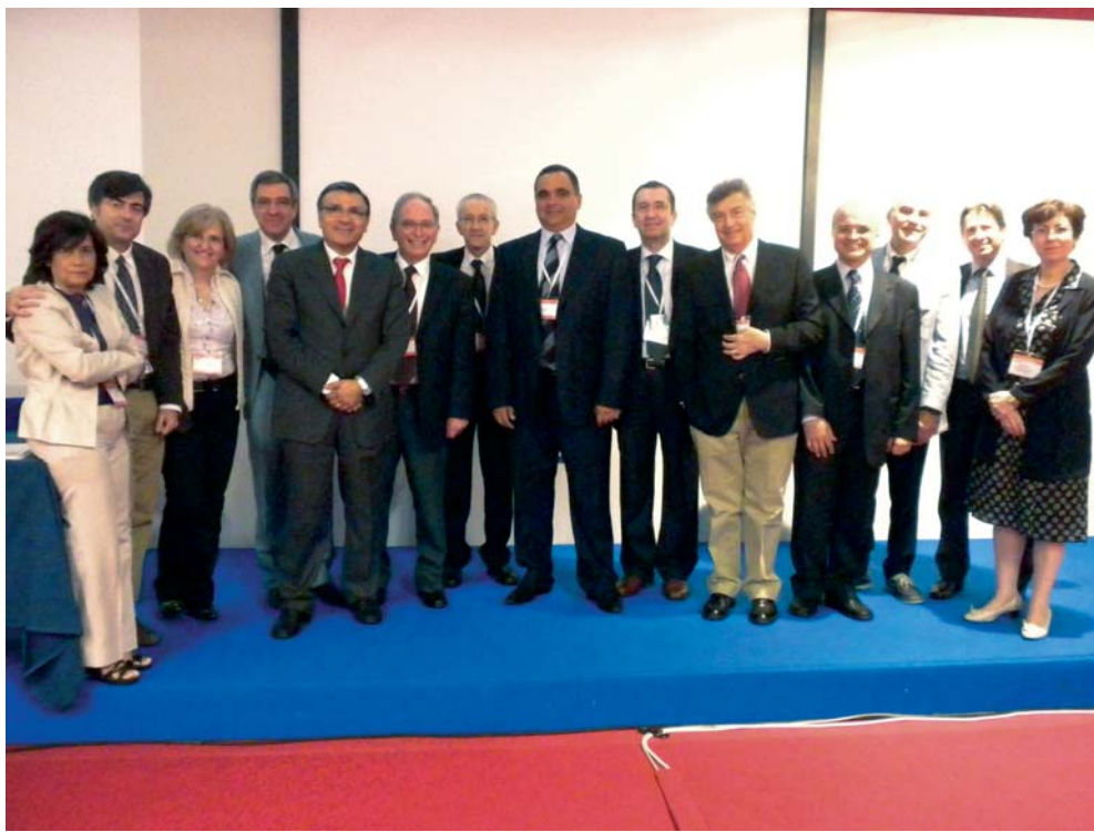
Foto di gruppo dei partecipanti alla Tavola Rotonda "Education and research in the Mediterranean area: can we find a common track?" svoltasi nell'ambito del XVI Congresso Nazionale SIN.